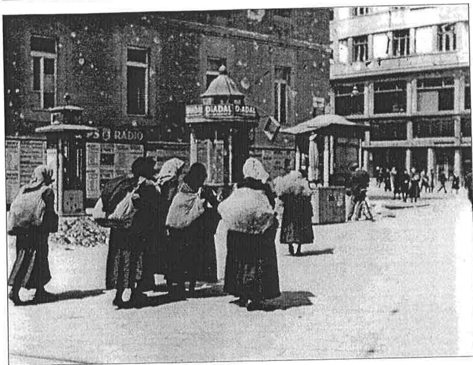
▪ 48. Battyuzó parasztasszonyok Budapesten, 1945 tavaszán. ▪

minimális ellentételezést kaptak, mindenféle más módon is igyekeztek elvonni a parasztok készleteit. Kenyérgabona őrletésekor például a termény negyedét, árpa- és kukoricadaráláskor pedig a termény tizedét kellett dézsmaként átadni az államnak. A levágott sertések után zsírdézsmát kellett leróni.